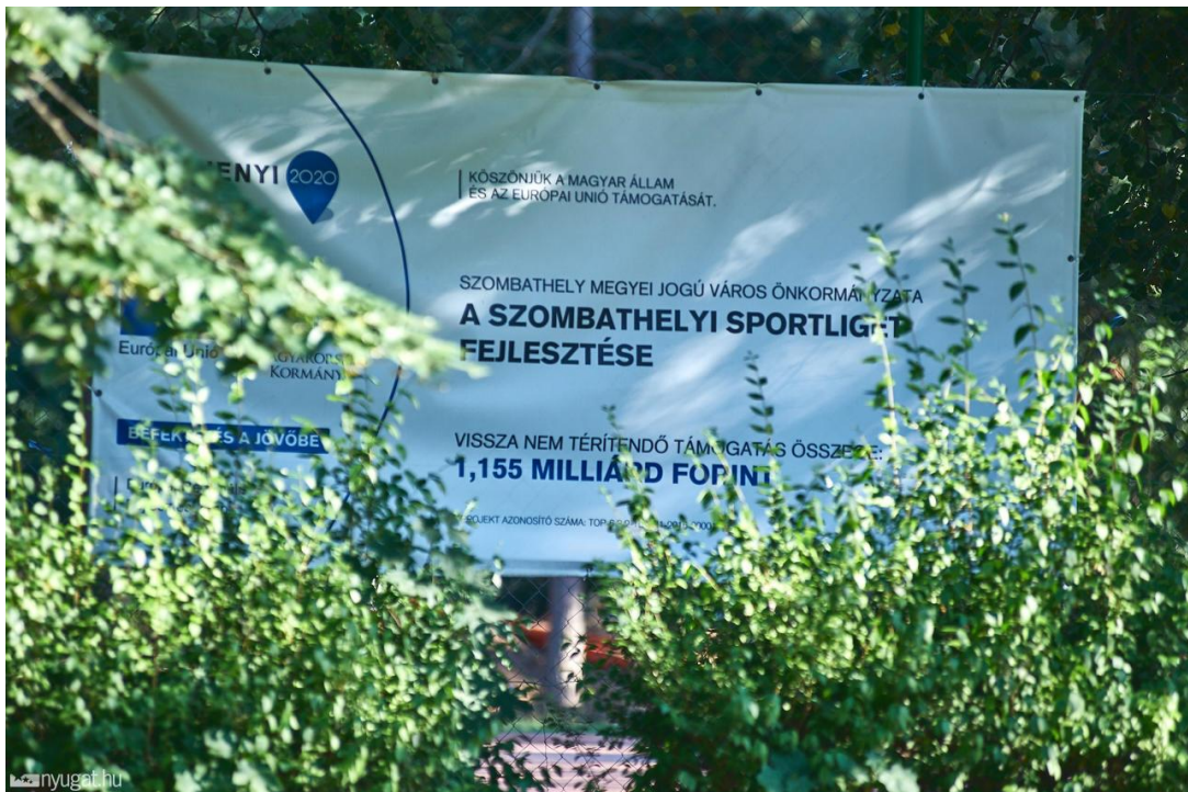
6. ábra A szombathelyi Sportliget fejlesztése