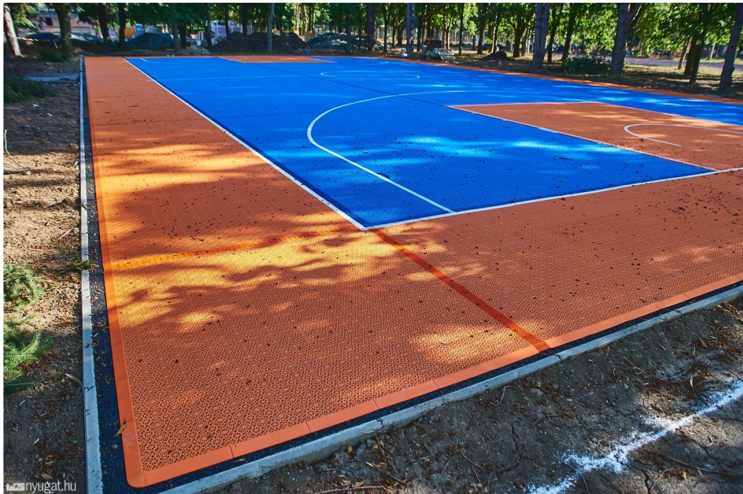
5. ábra A szombathelyi Sportliget fejlesztése