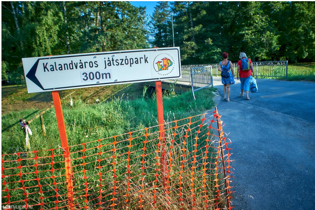
7. ábra A szombathelyi Sportliget fejlesztése