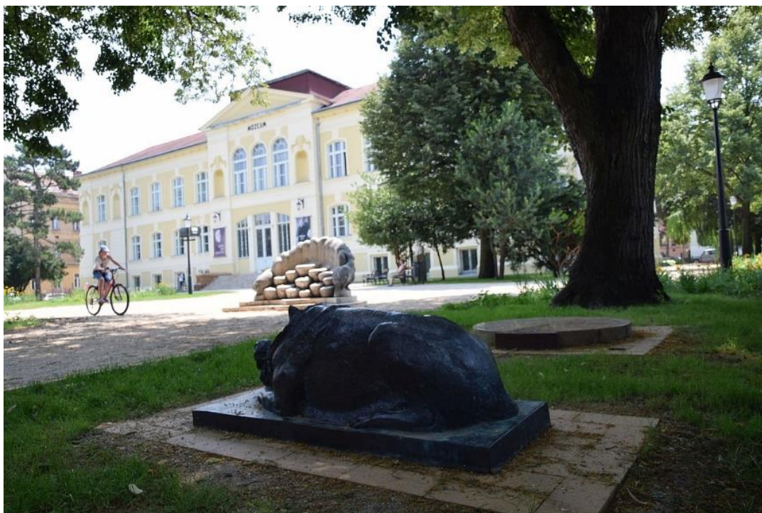
3. ábra A Savaria Múzeum parkja