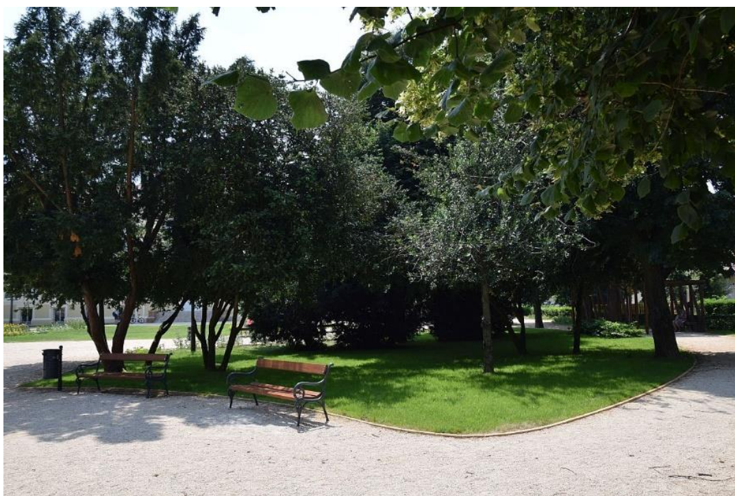
4. ábra A Savaria Múzeum parkja