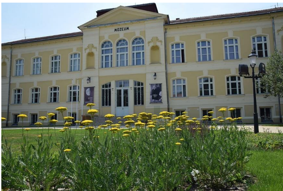
1. ábra Savaria Múzeum