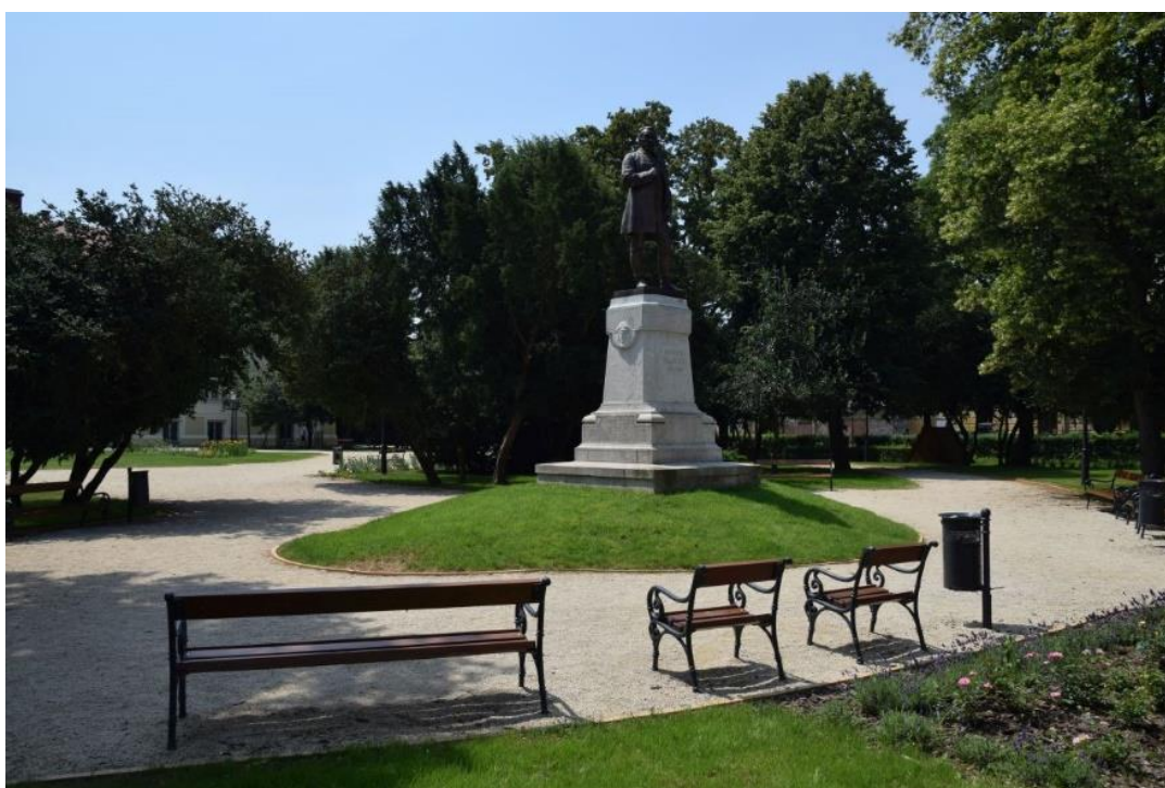
2. ábra A Savaria Múzeum parkja